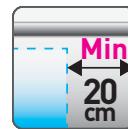
Überstand 20 cm